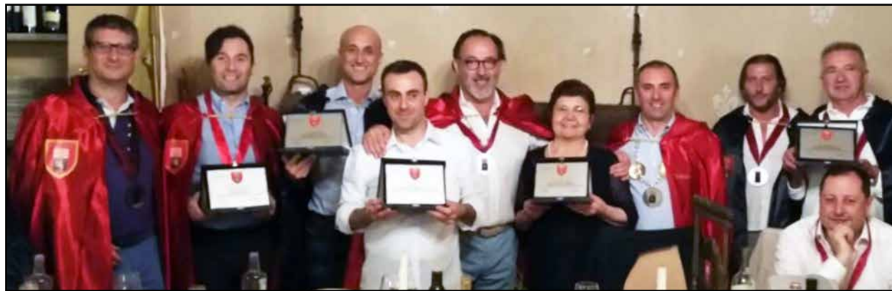
Premiazione alle sei migliori trattorie.