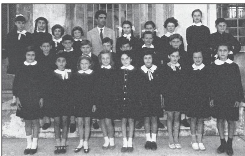
La classe mista del 1961.